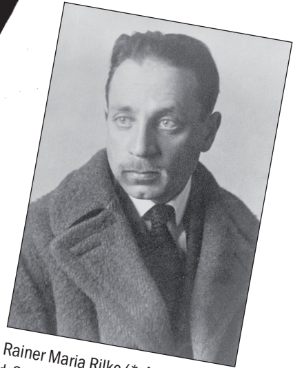
Rainer Maria Rilke (* 4. Dezember 1875 in Prag; † 29. Dezember 1926 in Montreux, Schweiz; eigentlich René Karl Wilhelm Johann Josef Maria Rilke)

Markiere alle Wörter, die auf eine Farbe hinweisen. Schreibe das Gedicht sauber mit einem schwarzen Stift und gestalte die markierten Wörter besonders.