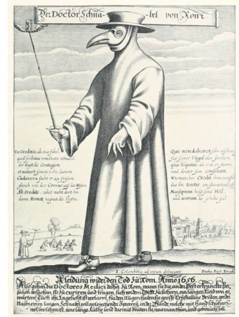
Quelle: Paul Fürst, Der Doctor Schnabel von Rom, ca. 1656; http://commons.wikimedia.org/wiki/File:Paul_F%C3%BCrst...Der_Doctor_Schnabel_von_Rom_%28Holl%C3%A4nder_version%29.png (7.4.2015).